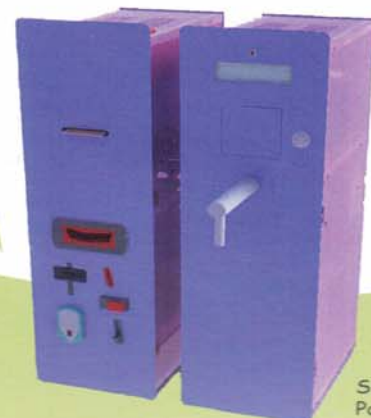
Sistema Pay + erogatore